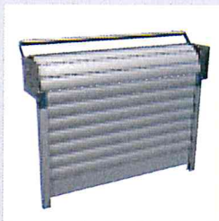
LAKAL-Rapide et TradiFast